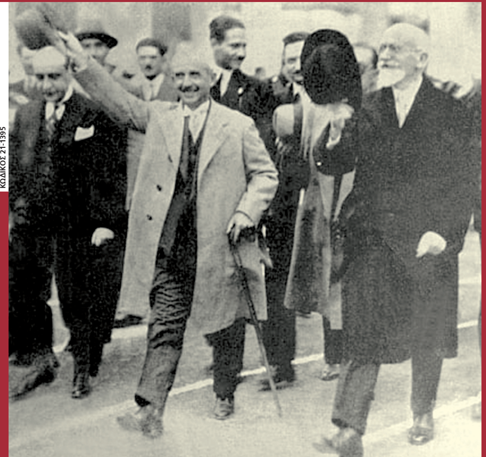
Ο Ελευθέριος Βενιζέλος και ο Ισμέτ Ινονού στη Λωζάνη