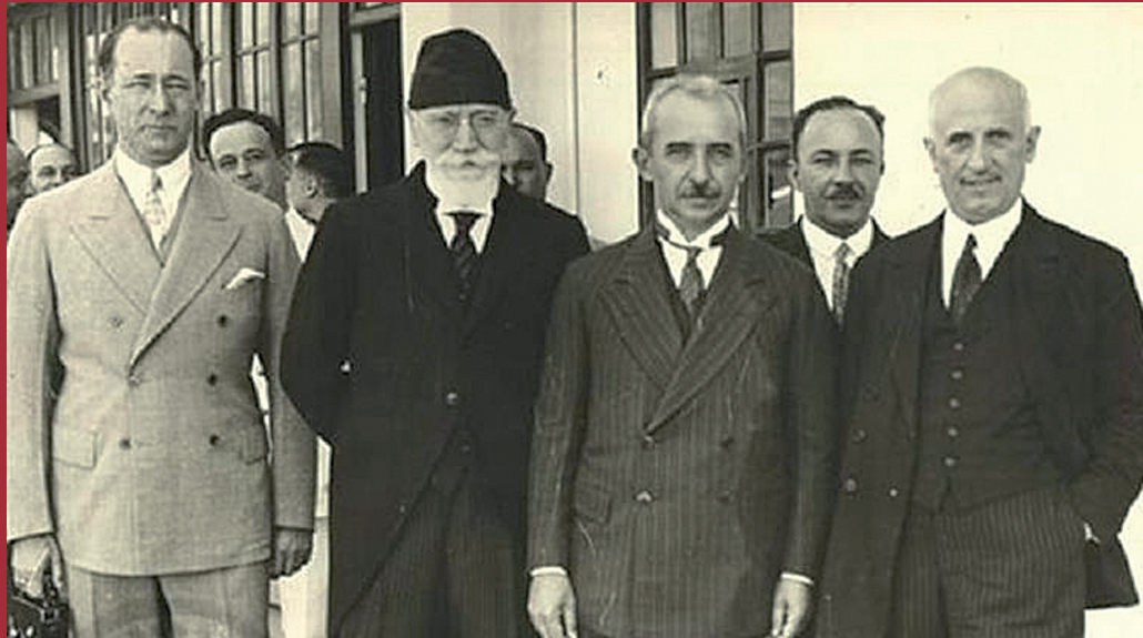
Οι επίσημοι μετά την υπογραφή της Συνθήκης Λωζάνης

1923-2023: ΕΚΑΤΟ ΧΡΟΝΙΑ ΑΠΟ ΤΗ ΣΥΝΘΗΚΗ ΤΗΣ ΛΩΖΑΝΗΣ ΣΤΙΣ 24 ΙΟΥΛΙΟΥ 1923