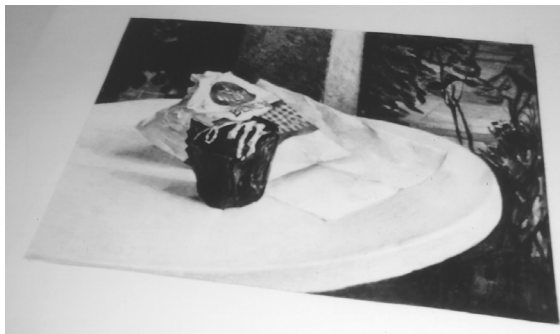
Καφενείον Βενέτης 6:00 π.μ. 2023, μολύβι σε χαρτί 30x42εκ.